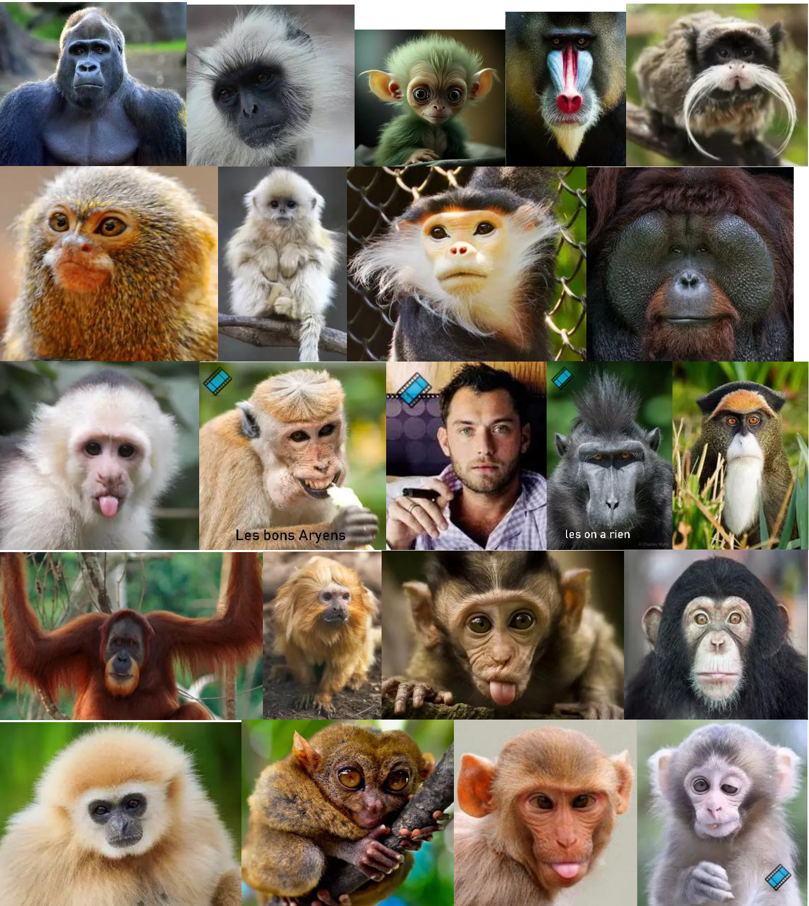
Les bons Aryens