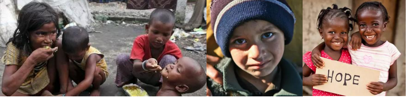
Je vous donne la spHere , please help...